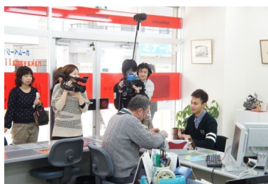
ユージに取材を受ける社長