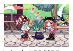
インターネットRPG「ラテール」