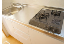
人気の2口ガスコンロ