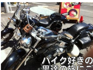
バイク好きの大家さん、是非一緒に男達の旅にご参加しませんか。

HPのスタッフブログをご覧になっている大家さんへご存じでしょう。丸進不動産に新しい部活動が発足しました「ライセンス取得部」「ツーリング部」ライセンス取得部は「宅建資格」はもちろんですが現在活発なのが「二輪免許」の取得です。終業後、鴨居自動車学校にせっせと通い、取得に励んでいます。そして取得後は「ツーリング部」のライダーたちが集結し、休日遠征に繰り出しています!