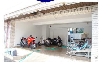
貸店舗部分を駐輪場に変更!!