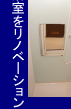
浴室をリノベーション

細かい部分ですが、生活をする中で、あったら便利だと思いうる配りを具現化しました。テーマカラーは木のぬくもりを大切にブラウン調や、モダンなイメージのブラック調。爽やかな雰囲気ホワイイト調など様々。2DK↓人気の広い1LDK、和室↓全洋室へ、クロゼットとシンテムキッチン。バランス釜から最新ユニットバスへ。脱衣所は広く、トイレ便器も節水型に。完全間取り変更で築年数をまったく感じさせない室内に仕上がりました。